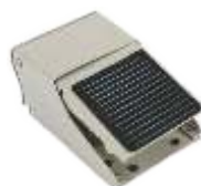
NOŽNI RAZVODNIK - PEDALA