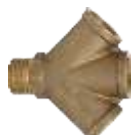
Y RAZVALNIK SA 3 IZLAZA - (MESING) -