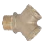
Y RAZVALNIK SA 2 IZLAZA - (MESING) -