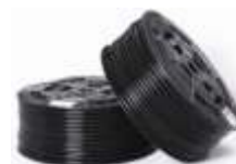
CREVA ZA VAZDUŠNE INSTALACIJE POLIAMID 12 CRNO