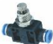
PRIGUŠNO-NEPOVRATNI VENTIL METALNI