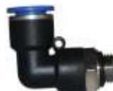
KOLENASTI OBRтни METRI KI