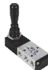
RAZVODNIK SA RUČICOM (JOYSTICK)