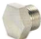
EP NAVOJNI MUŠKI SA BSP NAVOJEM