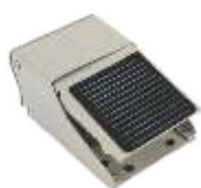
NOŽNI RAZVODNIK - PEDALA