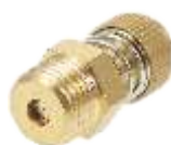
PRIGUŠNICI BUKE (PODESIVI)