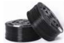
CREVA ZA VAZDUŠNE INSTALACIJE POLIAMID 12 CRNO