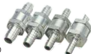
NEPOVRATNI VENTIL GORIVA (ALUMINIJUMSKI)