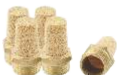
PRIGUŠNICI BUKE (DUŽI)