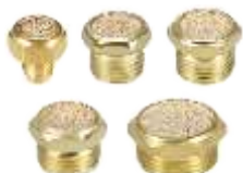
PRIGUŠNICI BUKE (KRA I)