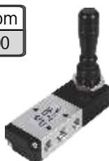
RAZVODNIK SA RUCICOM (JOYSTICK)