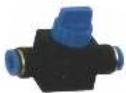
PNEUMATSKI VENTIL PLASTI NI