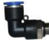
KOLENASTI OBRтни METRI KI