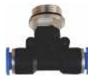
TROKRAKA NAVOJ U SREDINI COLOVNE