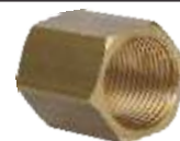
MUF - (MESING) -