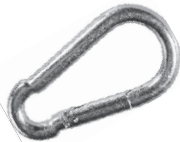
Karabinjer sa oprugom DIN 5299