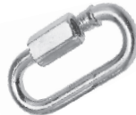
Karabinjer sa navojem